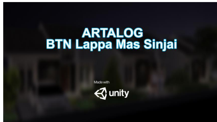
Gambar 2. Interface ARTALOG