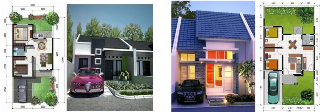
Gambar 4. Tipe rumah 36 dan Tipe 45

ARTALOG ini juga dilakukan percobaan pada perangkat mobile dengan berbagai spesifikasi untuk mengetahui spesifikasi minimal perangkat mobile yang dapat menjalankan teknologi ini. Hasilnya dapat dilihat pada tabel pengujian spesifikasi mobile berikut: