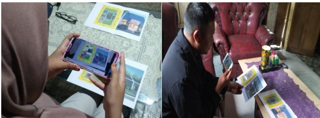
Gambar 3. Implementasi ARTALOG

Gambar 3 menjelaskan tampilan Camera AR dapat dipanggil dengan menekan tombol Camera AR . Di dalamnya terdapat kamera yang berfungsi untuk menscan marker yang sudah tersedia pada brosur yang disediakan. Ketika kamera men-scan marker akan menampilkan object 3D rumah. Dari hasil implementasi disimpulkan bahwa pengujian loading scene , pengujian menu utama dan pengujian menu camera AR dalam aplikasi tersebut dinyatakan valid atau berjalan sesuai dengan hasil yang diharapkan. Adapun gambar tipe rumah dari brosur dapat dilihat pada gambar 4. Type rumah 36 dan 45.