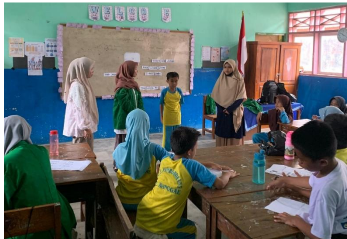
Gambar 2. Siswa membaca di depan kelas

Pada pertemuan kedua, kegiatan dilanjutkan dengan pengkajian ulang materi massureq dan diskusi mengenai bacaan "Cicci dan Buah Kejujuran." Enam siswa secara sukarela menjelaskan kembali nilai-nilai yang mereka pelajari, seperti sopan santun, saling menghargai, dan tolong-menolong. Meskipun sebagian siswa belum sempat membaca secara mandiri, mereka menunjukkan sikap positif dengan saling membantu teman yang mengalami kesulitan membaca. Selama proses membaca kelompok, setiap anggota kelompok saling menyemangati satu sama lain, yang menunjukkan tumbuhnya semangat kerja sama dan kepedulian sosial.