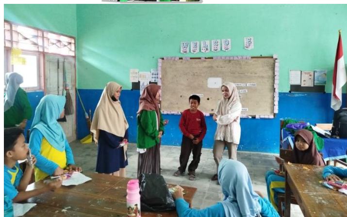
Gambar 3. Refleksi

Hubungan antara teori dan temuan dalam kegiatan ini menunjukkan bahwa pendekatan berbasis kearifan lokal efektif dalam membangun karakter siswa. Teori pendidikan karakter menekankan pentingnya internalisasi nilai melalui pengalaman langsung dan keteladanan (Lickona, 2012). Implementasi massureq melalui dongeng, permainan, dan refleksi memberikan pengalaman belajar yang bermakna bagi siswa, sehingga nilai-nilai yang diajarkan lebih mudah dipahami dan diterapkan. Selain itu, pendekatan bermain sambil belajar yang diterapkan dalam kegiatan ini sejalan dengan teori perkembangan kognitif Piaget yang menekankan pentingnya pembelajaran melalui pengalaman konkret pada anak usia sekolah dasar (Cahyadi dan Mubin, 2025).