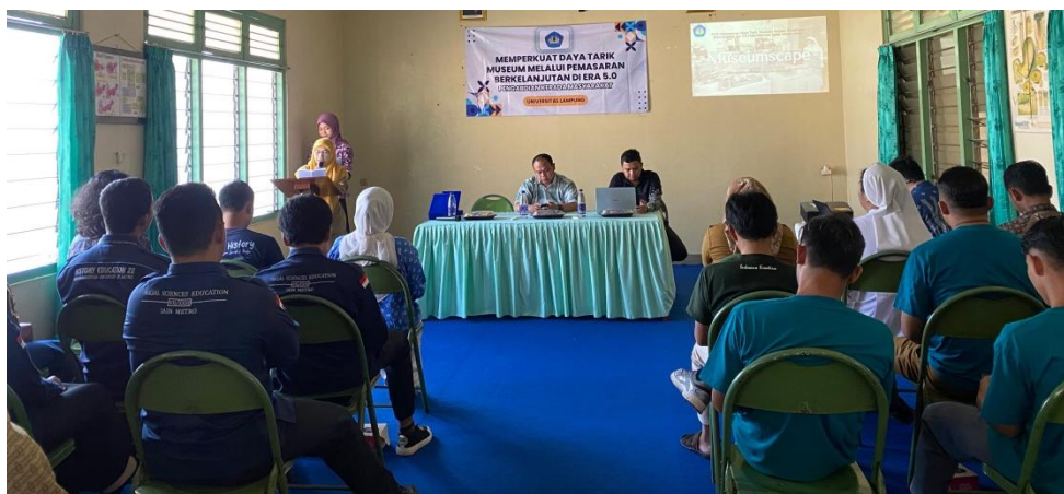
Gambar 2. Pelatihan Pengelola dan Pelaku Budaya di Museum Mini Santa Maria