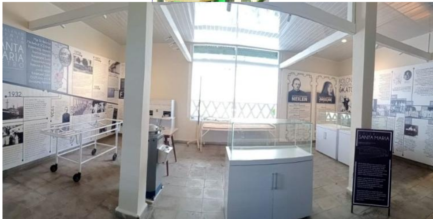
Gambar 1. Tampilan Museum Mini Santa Maria

Museum Mini Santa Maria yang diresmikan pada Februari 2022 telah menjadi ikon warisan sejarah Kota Metro dan pusat pembelajaran terkait penyebaran agama Katolik, penyediaan fasilitas kesehatan sejak masa kolonial Belanda hingga menjadi klinik kesehatan tertua di Metro. Adapun penguatan kapasitas pengelola dan pelaku budaya dapat dilakukan antara lain: