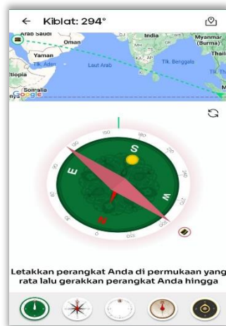
Gambar 1. 3 Tampilan kompas menunjukkan arah Kiblat

Pada gambar diatas menunjukkan bahwa ketika menu Kiblat di klik, maka akan muncul gambar kompas yang akan menunjukkan arah kiblat, yaitu ke ka'bah, cara pengaplikasiannya adalah dengan meletakkan hp kita di tempat yang rendah setelah itu kita biarkan sampai kompas mendeteksi arah kiblat, alan tetapi kita harus mengaktifkan Lokasi di hp dulu, supaya lokasi kita bisa terdeteksi oleh aplikasi, setelah itu maka kompas akan menunjukkan arah kiblat, dengan cara, mengikuti jarum yang didepannya ada gambar ka'bah kecil pertanda bahwa itu adalah arah kiblat untuk sholat.